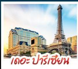
เดอะ ปารีสเซียน

สัมผัสบรรยากาศ เดอะ เวเนเซียน มาทากู เสมือนได้เยือนลาสเวกัส ชมความวิจิตรตระการตาของพระราชวังหอนหิมหอนใหม่แห่งจุไห้ เช็กอินกับแลนด์มาร์กสุดฮิตจตุรัสฮวาถึงถ่ายรูปลูกับหอทีวีของกวางเจา เที่ยวชมหมู่บ้านสไตล์ยุโรปแห่งใหม่ของเซินเจิ้น • ซ้อปิงเพิลิน ๆ ที่ ห้างสรรพสินค้า COCO PARK ถนนคนเดินฟู้หวลี้และถนนคนเดินบิกทิง