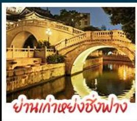
ย่านเก่าแห่งซิงฟาง