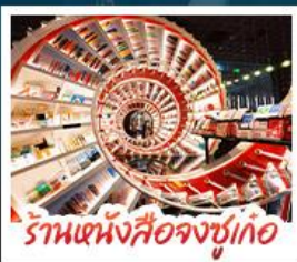
ร้านหนังสือจุงซูเกอ