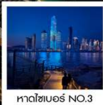
หาดไซเบอร์ NO.3