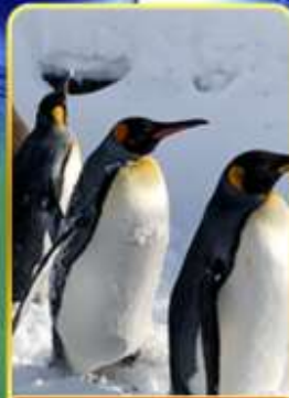
พาเหรดกเพนกวิน