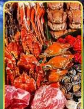
ปิ้งย่างพรีเมียมมันตะ