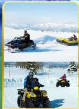
BIBAI SNOW LAND