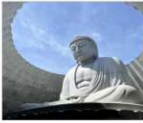
HILL OF BUDDHA