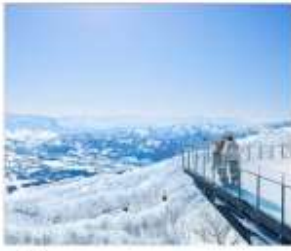
ชมวิวFOREST OF TREE