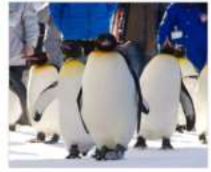
ชมพาเหรดแพนกวิน