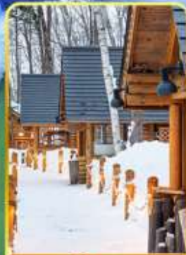
มิงเกิ้ลเกอเร