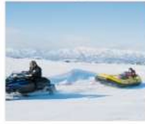
กิจกรรมบีโบสโนว์แลนด์