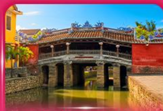
สะพานญี่ปุ่นโบราณ ฮอยอัน