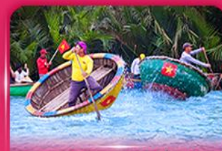
ล่องเรือกระดัง หมู่บ้านกิมทาน