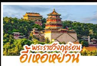
พระราชวังฤดูร้อน ฮ้อเจ้อเซี่ยวัน