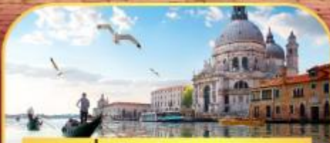
นั่งเรือสุทเกาะเวนิส