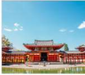
วัดเมียวโดอินมรดกโลก