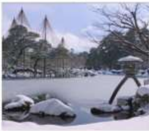
สวนเดนมะรุคเซ็น