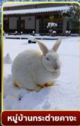
หมู่บ้านกระต่ายคางะ