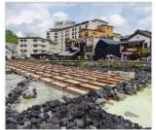
ชมยูบะทาเทะคุสึทสึ