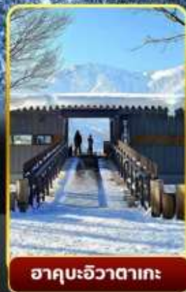
ฮาคุบะอิวาตาคะ