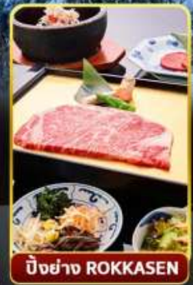
ปิ้งย่าง ROKKASEN

🌊 ออนเซ็น 3 คั้น 🧳 มน.กระเป๋า 1 ใบ 23 กก 🌞 9Days 6Night