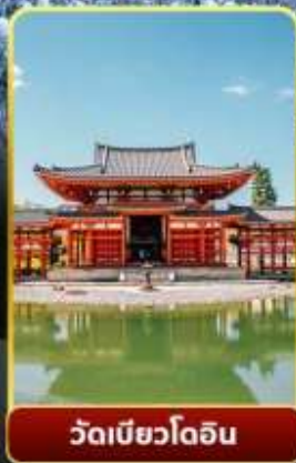
วัดเมียวโอดอิน