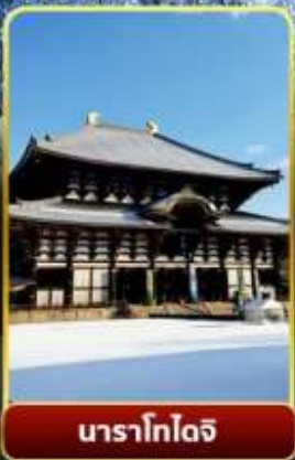
นาราโทไดจิ

พิเศษพักในเมืองคุสัทสึออนเซ็นพร้อมชมยูบาคาเกะ