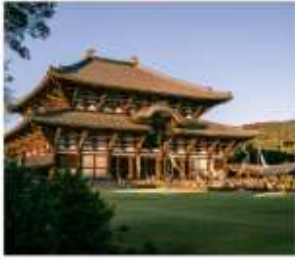
วัดโทไดจิ นารา