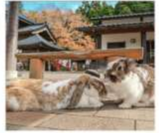
หมู่บ้านกระต่ายดางะ