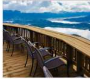
มิกะตะ 5 ทะเลสาบ