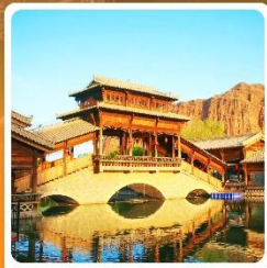
เมืองเล็กตุนหวง