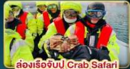
ล่องเรือจับปู Crab Safari

📅 เดินทาง: 08-16 ต.ค. | 07-15 พ.ย. 30 พ.ย. - 08 ธ.ค. 69