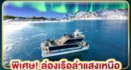
พิเศษ! ล่องเรือสำแสงเหนือ