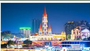
ท่าเรือกิ่งจื่อ

เขาชิงชู้สวนดอกไม้ตามฤดูกาล หมู่บ้านสไตล์ยุโรปเที่ยงวัน มังซิง เสี่ยวเจิน ถนนคนเดิน NANNING ZHIYE - เมืองโบราณไท่ผิง ท่าเรือกิ่งจื่อ - ถนนคนเดิน สามตรอกสองซอย