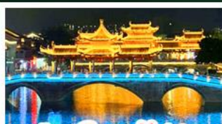
เมืองโบราณไท่ผิง