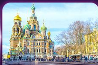
โบสถ์แห่งหยดเลือด