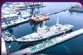
เรือตัดน้ำแข็งเลนิน