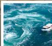
คลองเรือขมบ้านนาสุโตะ

คลองเรือขมบ้านนาสุโตะ / ซุปบึงย่านชินโซบาช / ตลาดปลาคุโรเมง / ซุปบึงย่านอุมาเดะ