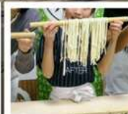
กิจกรรมทำเส้นอุด้ง