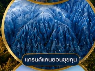
แกรนด์แคนยอนซูยคุน