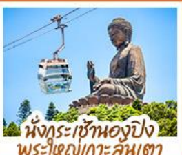
นั่งกระเช้าของปิง พระใหญ่เกาะคัมตา