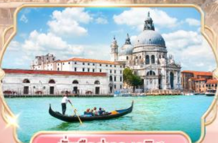
นั่งเรือสู่เกาะเวนิส