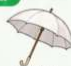
ร่มกันยูวี