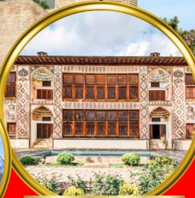
Palace of Shaki Khans