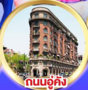
ถนนอู่คัง