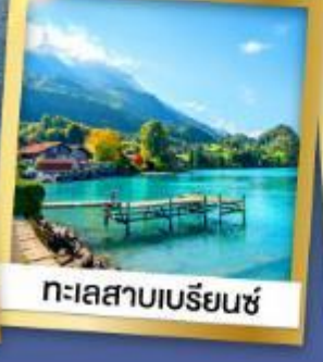
ทะเลสาบเบรีนซ์