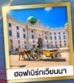
ชอฟเฟอร์เวียนนา