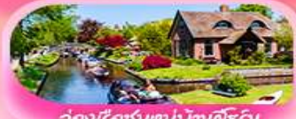
ล่องเรือชมหมู่บ้านทิวริน

เดินทาง 19 -26 มี.ค.69 / 27 มี.ค. - 3 เม.ย.69 2 - 9 เม.ย.69 / 9-16 เม.ย.69 28 เม.ย. - 5 พ.ค. 69 / 3 - 10 พ.ค.69