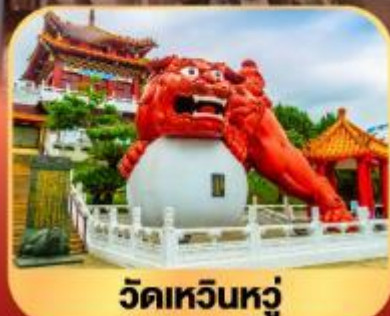
วัดเหวินหนู่